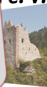
Schiltach - Schiltach

Aufgrund der derzeitigen Coronarestriktionen ist momentan eine Durchführung dieser Veranstaltung nicht möglich. Laut aktueller Mitteilung der NZZ soll sich dies aber bei weiterhin positiver Entwicklung zum 15. Juni ändern. Quelle: https://www.nzz.ch/schweiz/grenzen-zu-schweizer-nachbarstaaten-sollen-im-juni-oeffnen-ld.1556415 Vielleicht müssen wir die Hoffnung nicht aufgeben, es sind noch 4 Plätze zur Anmeldung frei. Bleiben Sie gesund und munter.